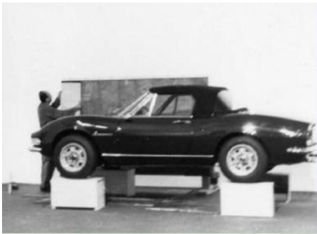
Alla ruota della Fiat Dino il « Compasso d'oro » 1967